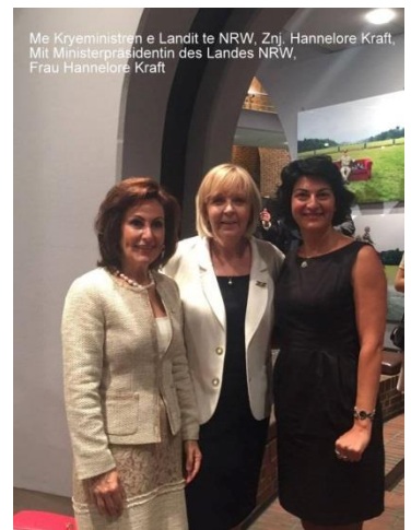
Me Kryeministren e Landit te NRW, Znj. Hannelore Kraft, Mit Ministerpräsidentin des Landes NRW, Frau Hannelore Kraft